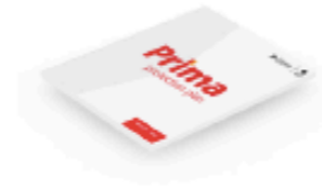
Prima Protection Plan

Fino a due anni di assistenza tecnica e copertura per i danni accidentali.